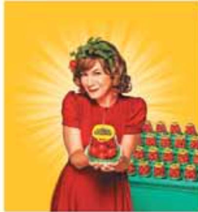
Las implementaciones de APC apoyan en gran medida el crecimiento de NatureSweet.

NatureSweet, marca de Desert Glory, empresa dedicada al cultivo, empaque y comercialización de tomate cherry, entre otros, es un caso de éxito de APC, debido a que sus soluciones ayudaron a la implementación y crecimiento de la empresa.