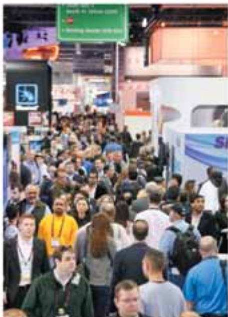
Miles de personas se darán cita para el CES 2012